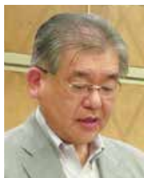
清水職業分類・ 会員選考委員長