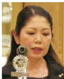
曾根原青少年奉仕副 委員長/IAC副委員長