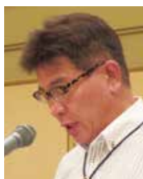
土屋職業奉仕委員長