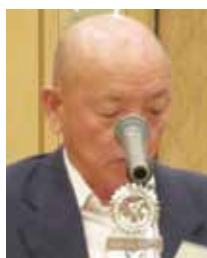
橘社会奉仕委員長