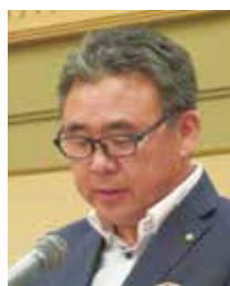
佐々木広報・IT推進 委員長