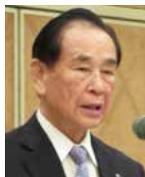
岩崎会員増強委員長