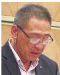
山口クラブ管理・ 運営委員長