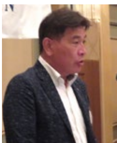
土屋公共イメージ委員長