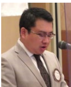
一杉社会奉仕委員長