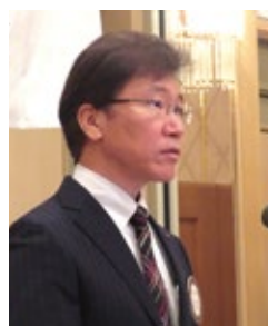
山下広報・IT委員長