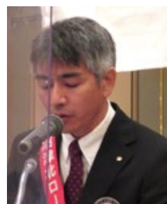
内野S A A