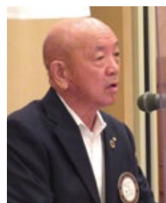
橘職業奉仕委員長