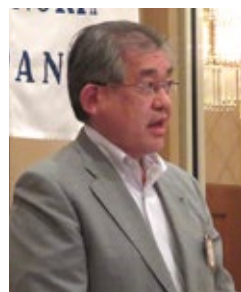
清水プログラム委員長