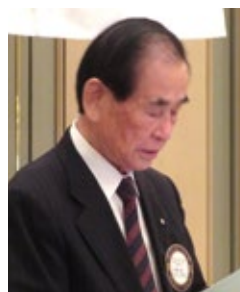
岩崎職業分類・会員選考委員長