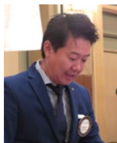
大嶽会報・雑誌委員長