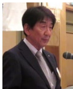
影島クラブ管理・運営委員長