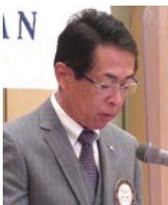
大塩会員増強委員長